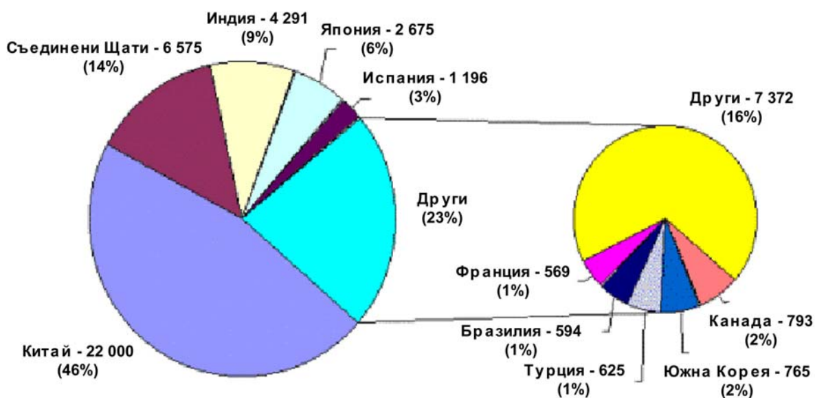
ФИГ. 1. Разпространение на язовирите в света (по страни)

Хидроенергията, напояването, питейното водоснабдяване и предпазването от наводнения са били основни аргументи за оправдаването на значителни инвестиции, вложени в язовирите, като разбира се са изтъквани и други предимства. Те включват ефекта за икономически просперитет на региона - увеличаването на растителната продукция, електрификацията на селищата и разширяването на физическата и социалната инфраструктура (пътища и училища). Предимствата са били очевидни. След изготвяне на баланса за разходите по строителството и експлоатацията при отчитане на икономическите и финансовите условия се констатира, че тези предимства се посочват като оправдание за приемане на язовирите като най-конкурентна възможност.